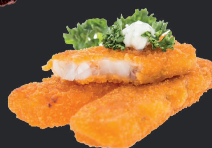
Filet de Colin Pané