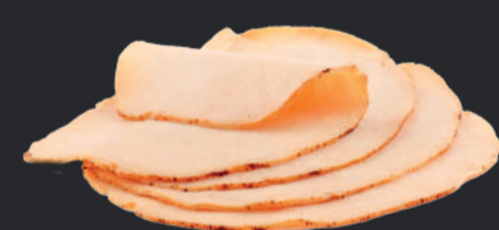
Jambon de dinde