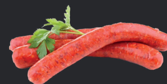
+1€ Merguez du Boucher